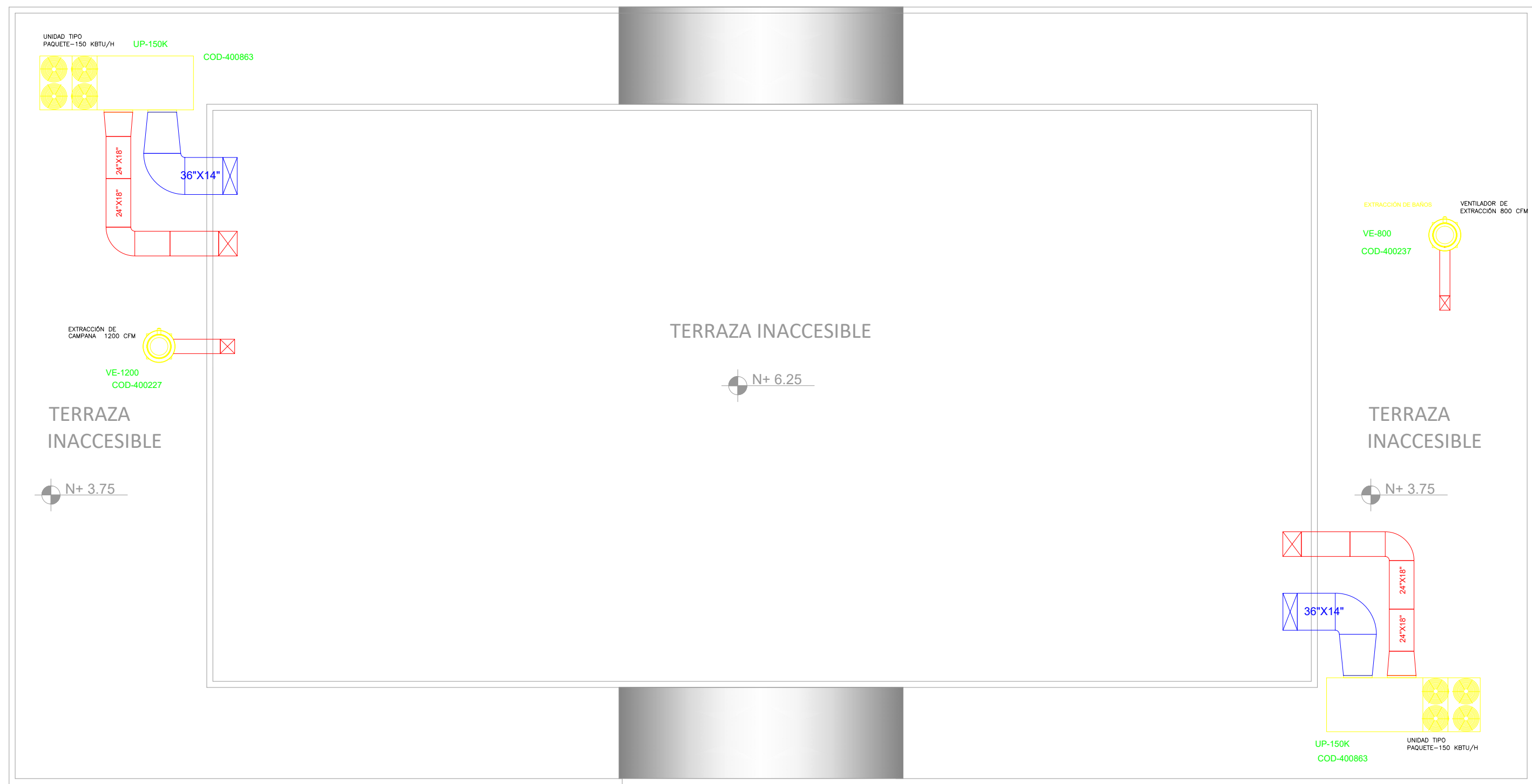
PLANTA DE CUBIERTA